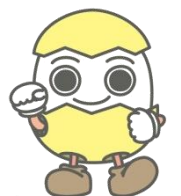
ワーキングサポーター