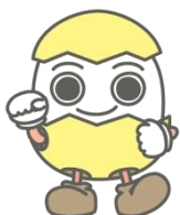
ワーキングサポーター