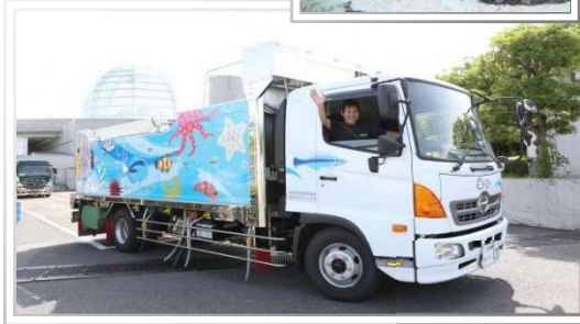
うみくる号の大型水槽を鑑賞