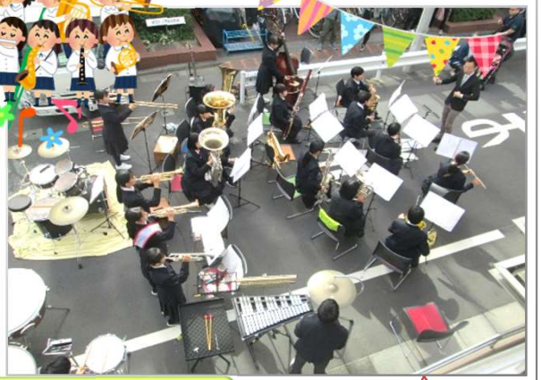
錦糸中学校吹奏楽部